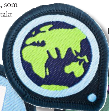
Internationellt – lyssna