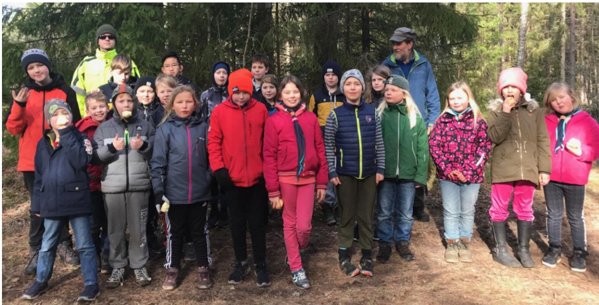
Marsvik - hela gänget

De populäraste mötena var när vi eldade och lagade något gott, vilket vi gjorde flera gånger.