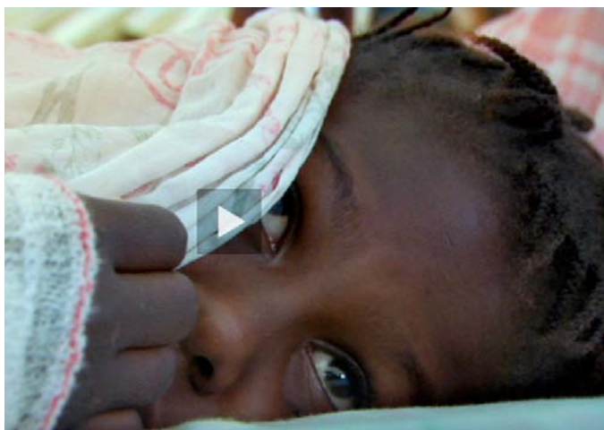
Klipp ur Barnen bakom rubrikerna – Haiti 15.23 – 20:30 Ur Barnen bakom rubrikerna – Haiti