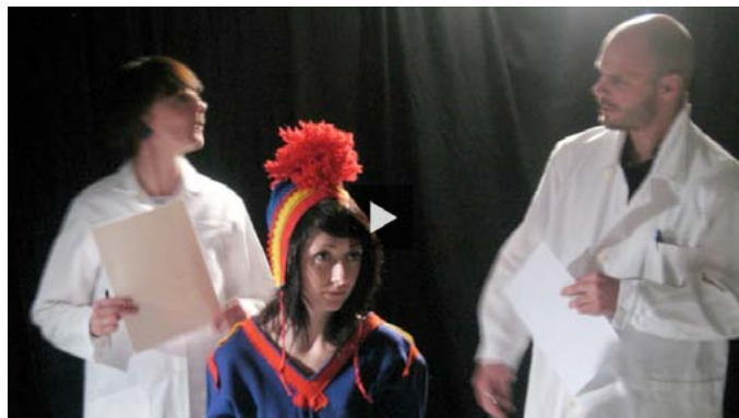
Ur radioprogrammet Rasismens historia

Bra sidor att hitta information på är bland annat Migrationsverket.se och unhr.se.